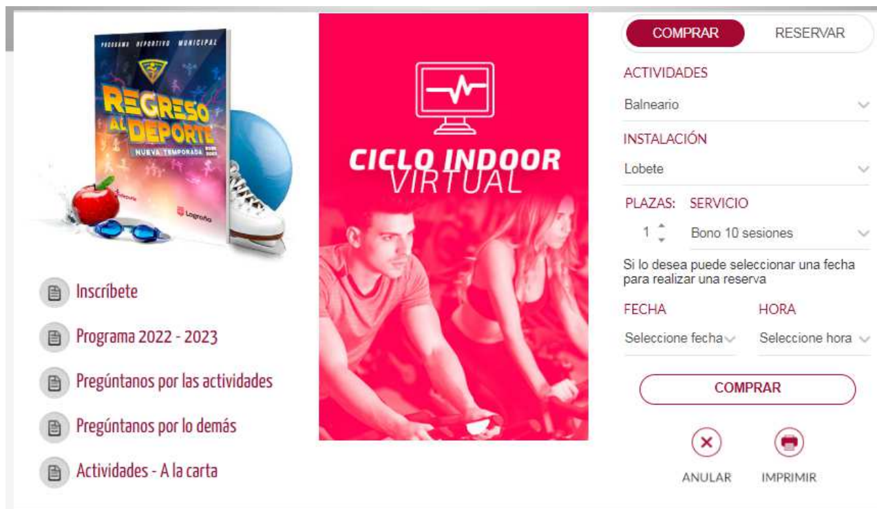
Bloques de publicidad con sistema integrado de reservas